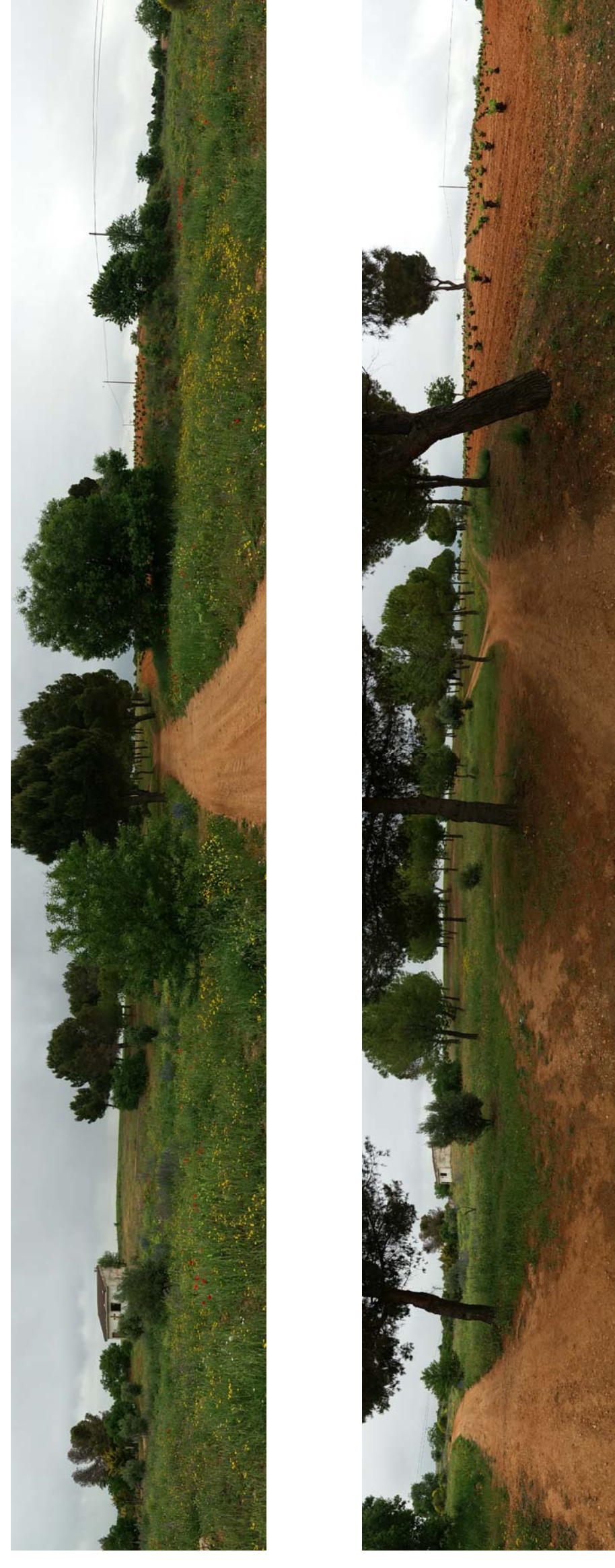
FOTOGRAFÍAS DE ESTADO ACTUAL

PARCELAS según LEVANTAMIENTO TOPOGRÁFICO Y CATASTRO E: 1/1000 Superficie total de parcelas, según topográfico: 8673.50 m 2 Superficie total de parcelas, según planimetría Catastral: 9085.57 m 2