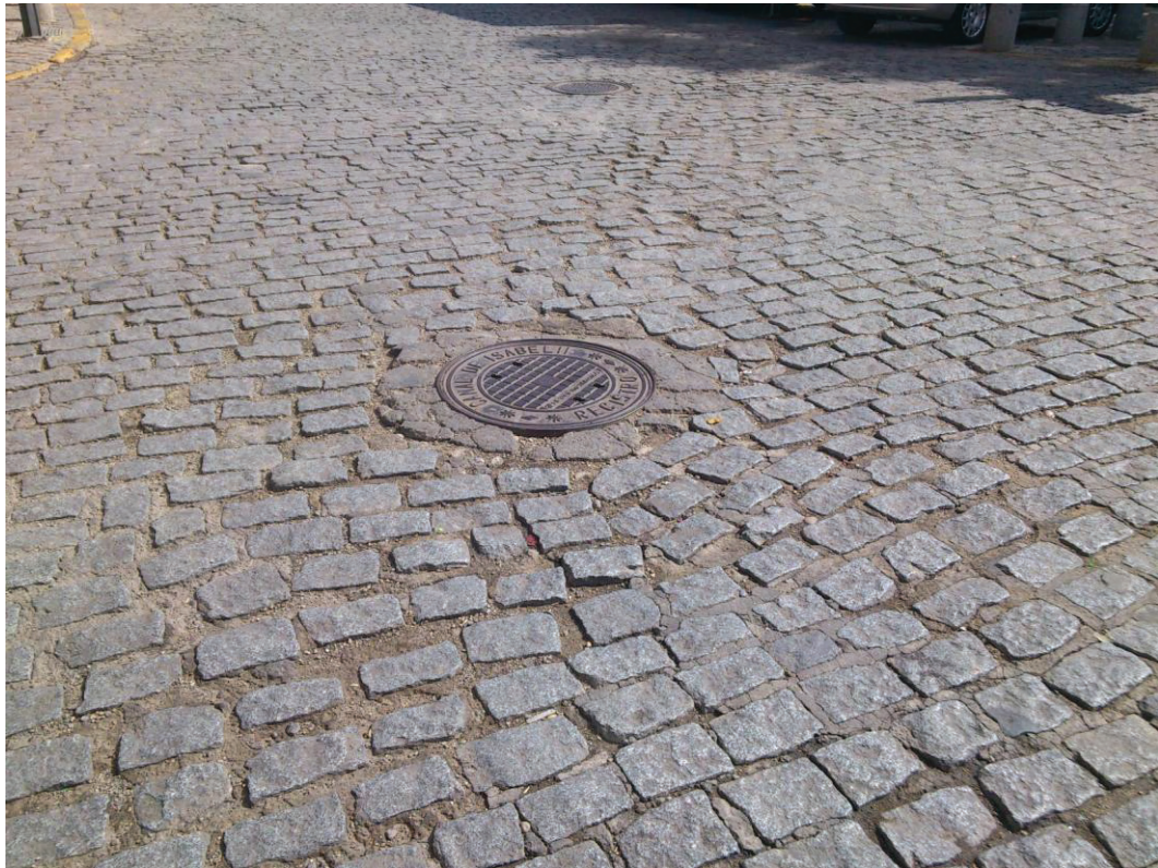
Pozo de registro de la red de Abastecimiento del Canal de Isabel II en la Calle Mesones esquina con Calle de la Iglesia y Plaza de la Constitución.