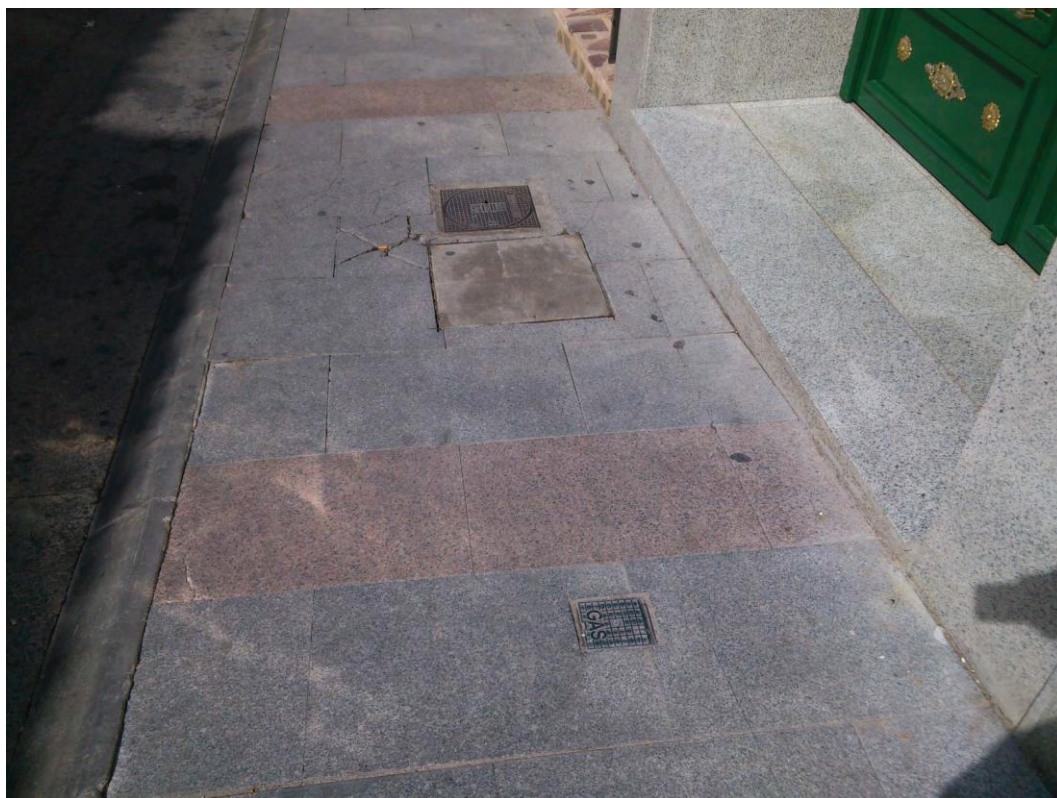
Instalación de Gas en la Calle Mesones.