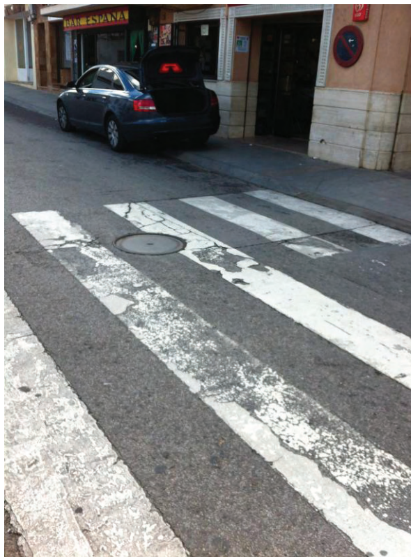
Pozo de registro de Saneamiento del Canal de Isabel II en la Plaza de España esquina con Calle de Lepanto.