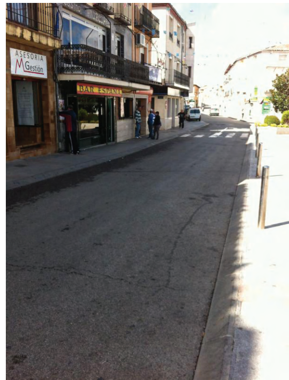
Vista de la Plaza de España.