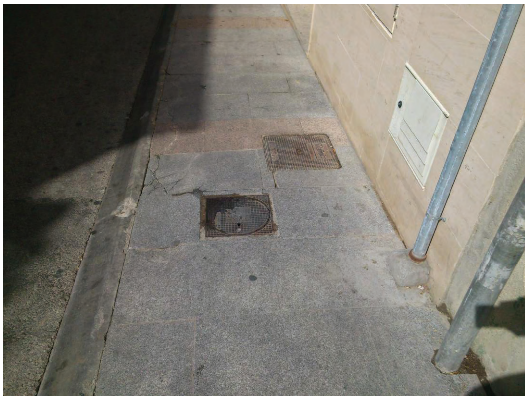
Instalación de Telefónica y acometidas de abastecimiento a las viviendas de la Calle Mesones.