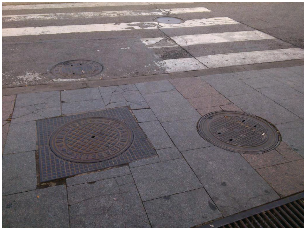
Baldosas de granito agrietadas.