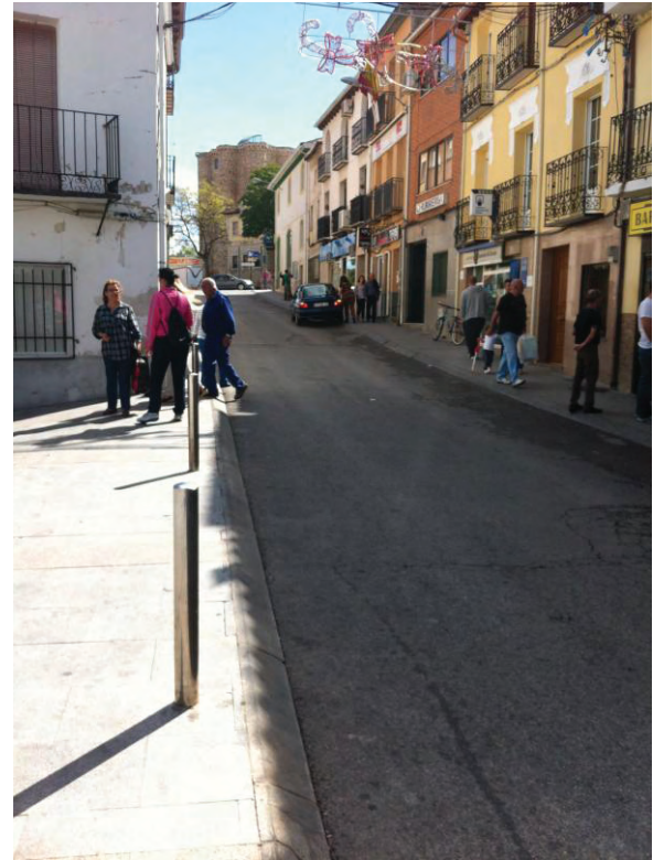
Vista de la Calle Mesones y Plaza España.