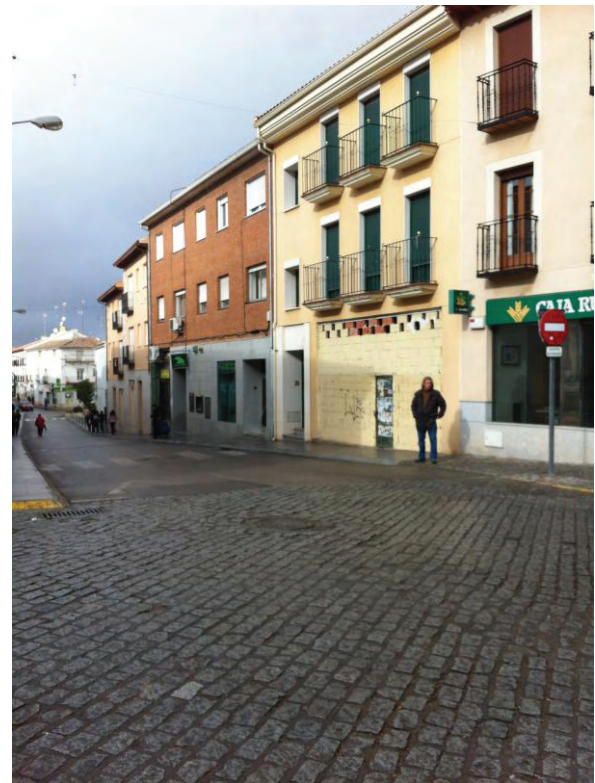
Vista de la Calle Mesones.