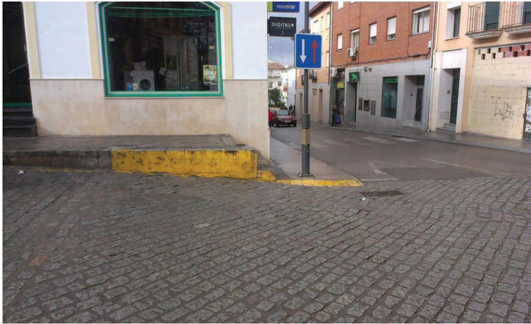
Vista de la Calle Mesones esquina con la Plaza de la Constitución.