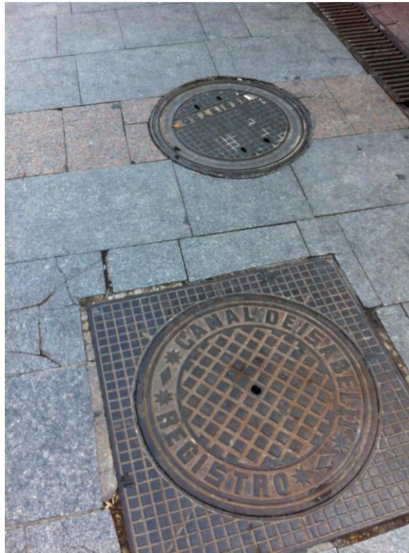
Pozos de Registro de Abastecimiento (inferior) y Saneamiento (superior) del Canal de Isabel II.