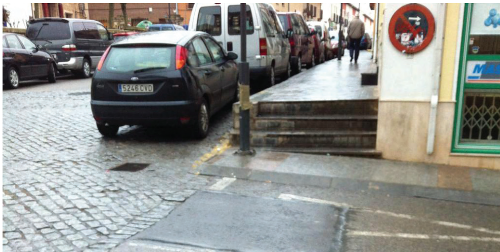
Imbornal en la Calle Mesones esquina con la Plaza de la Constitución.