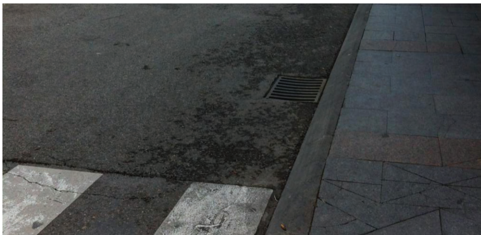
Imbornales en Plaza de España.