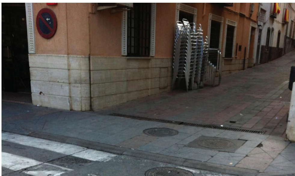
Imbornal en Calle de Lepanto.